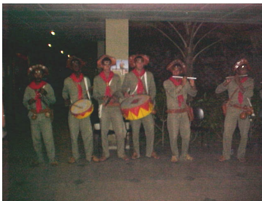
Figura 4 - Banda de Pífanos.

Os grupos de trabalho, considerado uma das partes mais importantes da programação de um evento desta natureza, abordaram temáticas relacionadas à filosofia do PET, à relação do PET com movimentos estudantis, à extensão universitária, às expectativas do PET no novo governo e ao formato dos encontros.