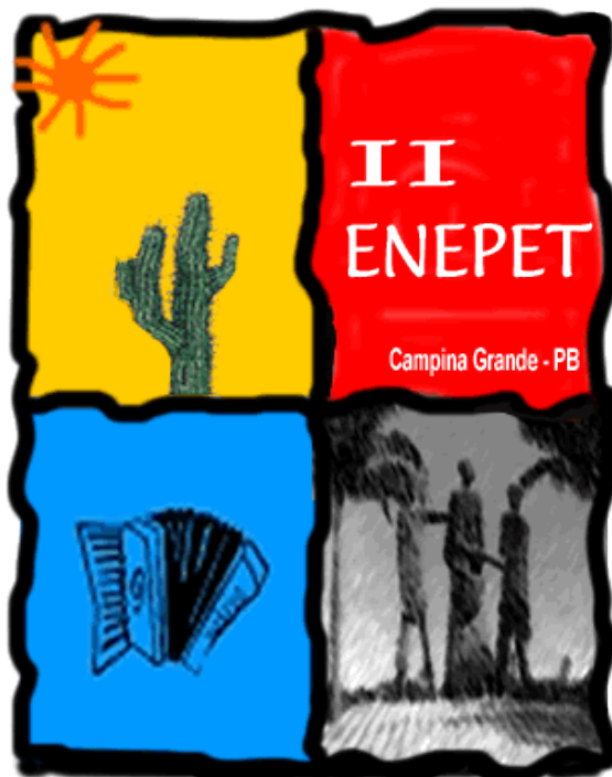
Figura 1 - Logo Marca do ENEPET

Na Figura 1 é apresentada a logo marca do evento, que tentou juntar em uma única imagem vários itens como a aridez do sertão e a cultura musical nordestina, estes inclusos na cidade de Campina Grande.