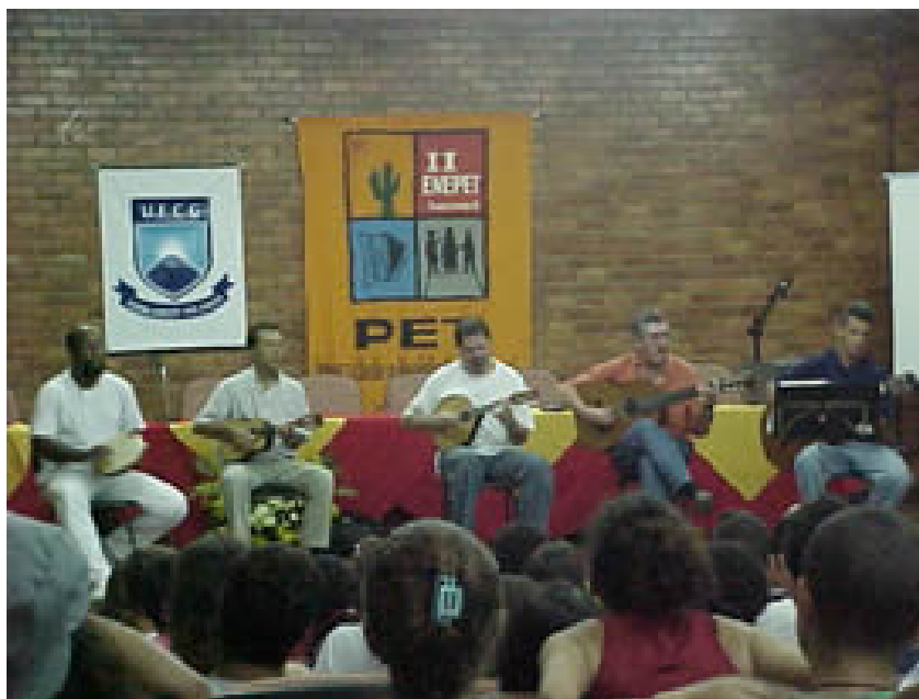
Figura 3 - Grupo de Chorinho.