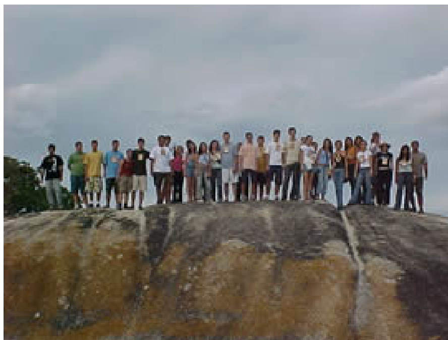
Figura 2 - Participantes do ENEPET no Parque das Pedras, Pocinhos-PB.

Inicialmente, no dia 24, antes da abertura oficial do evento, houve um passeio turístico pelo Parque das Pedras, na cidade de Pocinhos (Figura 2).